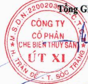
Lý Bích Quyên