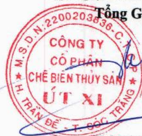
Lý Bích Quyên