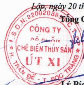
Lý Bích Quyên